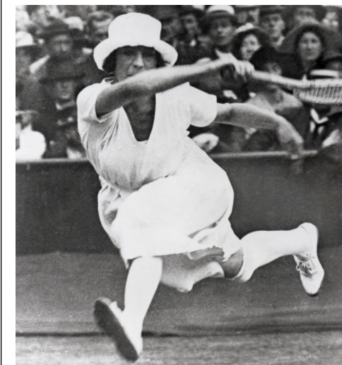
Sikken stil!! - i både teknik og tøj . . .